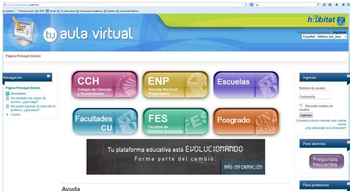
Fig.1. Pantalla de inicio de Tu Aula Virtual

Actualmente Tu Aula Virtual cuenta con más de 1500 aulas distribuidas en 6 categorías correspondientes a distintos niveles y planteles de la UNAM como se observa en la siguiente imagen.