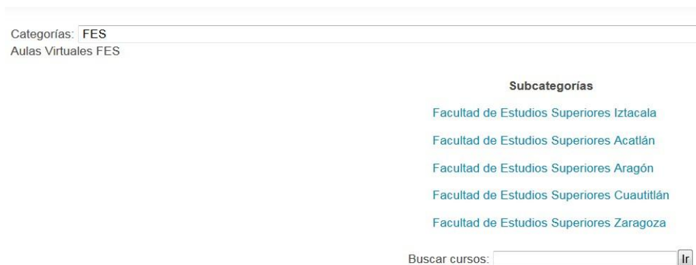
Fig.3. Subcategorías existentes dentro de Facultad de Estudios Superiores (FES)