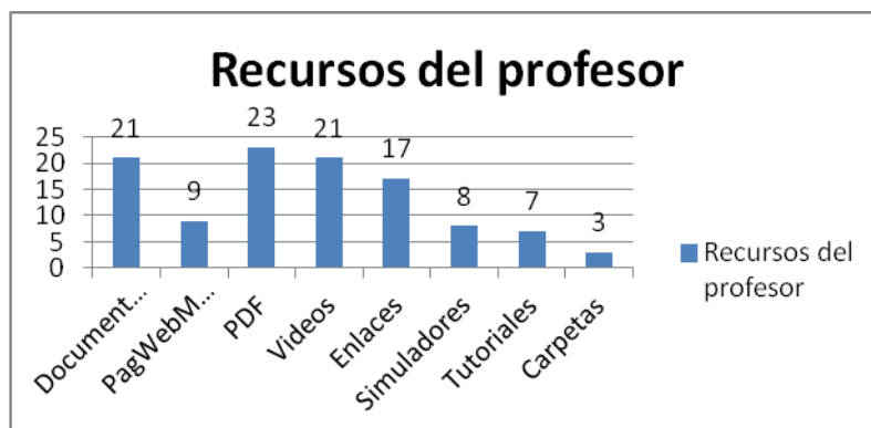
Fig. 4 Recursos que el profesor pone a disposición de sus alumnos (Documentos de ofimática, páginas web, pdf, etc.)

Documentos de ofimática. En la muestra revisada aproximadamente un 50% de los profesores pone a disposición de los alumnos archivos de ofimática, que en su mayoría son de documentos de texto elaborados con el procesador de palabras, tales como tareas, prácticas y ejercicios. También hay presentaciones electrónicas elaboradas por los profesores para introducir un tema o para presentar contenidos